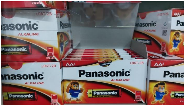
อา. 21 ส.ค.