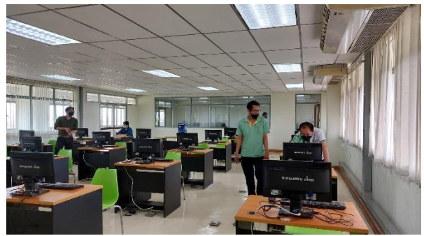
สำนักวิทยบริการฯ มรภ.วไลยอลงกรณ์ 9 มิถุนายน · 🌐

คณะกรรมการจาก สถาบันพัฒนาและทดสอบทักษะด้านดิจิทัล (ICDL) ได้มาตรวจสอบสถานที่ ห้อง IT 502 ตึกศูนย์ภาษา อาคาร 75 ปี เพื่อจัดตั้งเป็นศูนย์สอบ โดยมี ผู้อำนวยการและเทคโนโลยีสารสนเทศเป็นผู้ให้การต้อนรับ